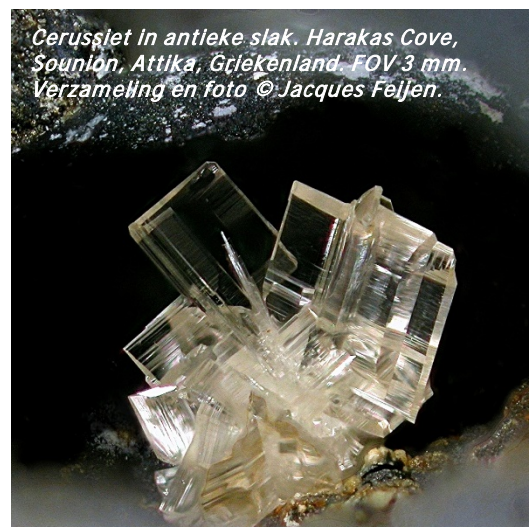
Cerussiet in antieke slak. Harakas Cove, Sounion, Attika, Griekenland. FOV 3 mm.

kristalletje. Wanneer kristallen niet vrij kunnen uitgroeien, bvb. omdat er zodanig veel kiemen zijn dat in plaats van een groot kristal er duizenden piepkleine kristalletjes ontstaan die op de duur geen