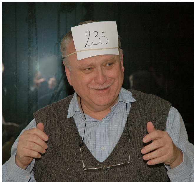
Specimens uit de verzameling van de auteur.

En omdat de boog niet altijd gespannen moet staan... wanneer we zeggen dat je altijd alles zorgvuldig moet labelen bedoelen we dat niet zo letterlijk als de interpretatie van die stellingname tijdens de MKA-veiling in 2014. Op die manier kon de veilingmeester wel onmiddellijk alle informatie terugvinden over het specimen... pardon, de bidder.