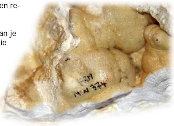
Code rechtstreeks op het specimen geschreven met zgn. 'Chinese inkt'. Smithsonian van Moresnet, Liège, België.

Er zijn nog tal van andere mogelijkheden om een labeltje te bevestigen op een specimen met een poreus oppervlak. Je kunt bv. eerst op de achterzijde van je labeltje een klein dotje kit bevestigen. Als je dan het etiketje met kit en al stevig tegen het oppervlak aandrukt zal het ook goed blijven zitten. Hiervoor moet je natuurlijk wel